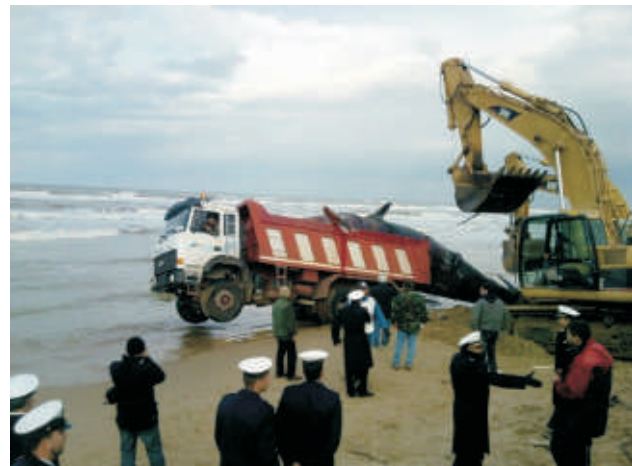
Tentativo (?) di rimozione e trasporto...