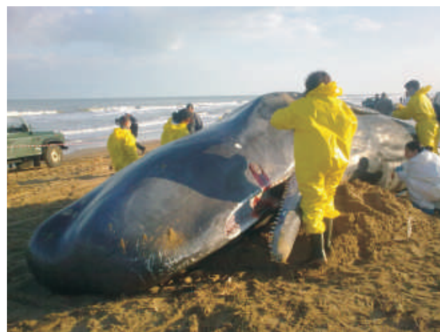
La fine della fine...