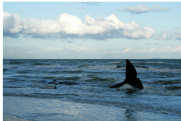
Ore 07.50 del 11.12.2009: Colpo di coda di un capodoglio