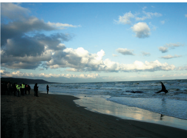
Ore 08.00 del 11.12.2009: Si resta spettatori